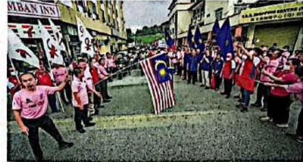
嘉宾为火炬行的车队进行挥旗礼，马华与行动党也各站一边挥动党旗，形成朝野对立画面。