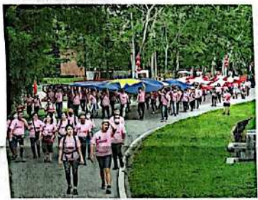
巨型国旗一路游走在市区，吸引路人目光。