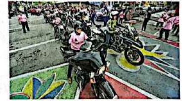
超级摩托车队成员中有不少友族，他们也一起参与中华文化传承工作。

“火炬行开跑以来，吸引了1万2000人参与，在各县印证了我们要云集华社的力量，而且不同背景的朋友，皆为文化传承工作坚持下去。”