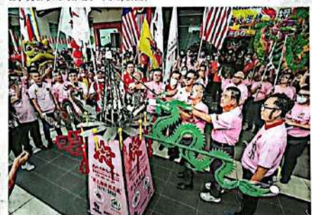
来到火炬行的最终站，嘉宾点燃文化圣炉。